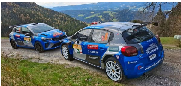
De to Team GLAD Sport biler Citroen C3 R2 4WD og Renault Clio R3 4WD i de Østrigske alper.