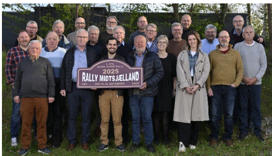
Den samlede løbsorganisation samlet til møde i Roskilde april 2025

Løbsorganisationen bag RM25 består af medlemmer fra henholdsvis DRC og ASKH, og omfatter knap 30 ledende officials