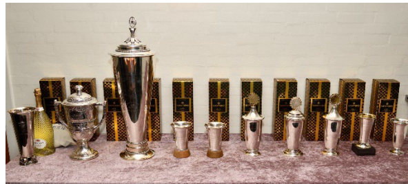
DRC's flotte og traditionsrige rallypokaler