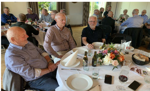
Efter middagen og kaffen var der godt gang i "rø-verhistorierne".