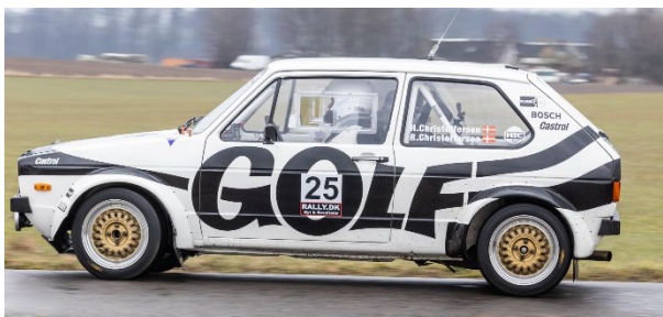
Brødrene Christoffersen i VW Golf GTI, type 1