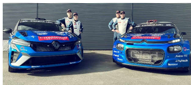
Brødrene Madsen med deres codrivere før starten på Rallye d'Antibes Cote d'Azur 2025