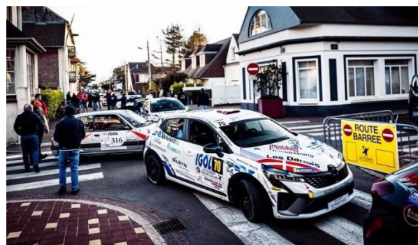
Oliver L. Sørensen / Frederik Glad i Renault Clio Rally5 i byen Le Touquet

Oliver og Frederik sluttede som nr. 55 generelt ud af 150 i mål, og nr. 11 i klasse RC5 ud af 27 i mål, i en køretid på 1:54:55,5.