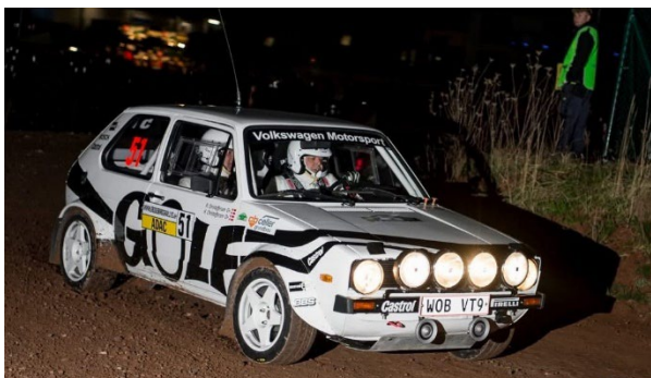
Henning & René Christoffersen i VW Golf GTI type 1 under aften prøverne i Rallye Erzgebirge 2026

centrum. Rallyet var tællende til det tyske rallymesterskab som 1. afd. og til det tyske historiske rallymesterskab også som 1. afd. Rallyet var på 491 km totalt, heraf 112 km asfaltprøver fordelt på 12 prøver. 2x2 prøver på hhv. 8,75 km og 8,05 km og 4x2 prøver på hhv. 7,88 km, 10,33 km, 6,41 km og 14,63 km. Der var 61 hold til start incl. Henning og René Christoffersen i deres flotte historiske VW Golf GTI type 1 (Den hvide dame) med start nr. 51. Det havde været snevejr i området natten før rallystart, men rallyet blev gennemført på både våde og tørre veje, og Henning og René opnåede en 40. plads generelt og nr. 3 i klasse NC4 i tiden 1:23:57,1.