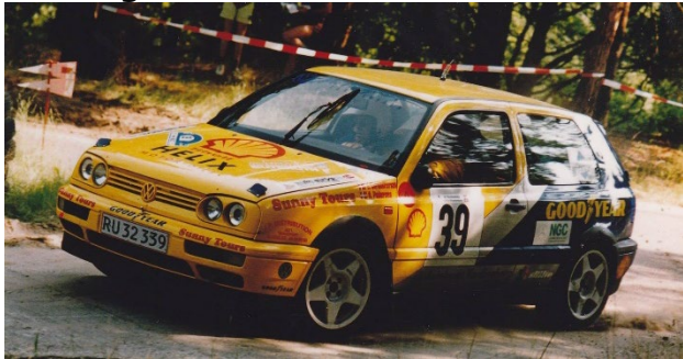
Henning Christoffersen med codriver Ole Pedersen i VW Golf GTI type 3 gr. A i Int. Haveland Rally 1996. Udgik på sidste prøve (WP 30) med "mangelende forhjul."