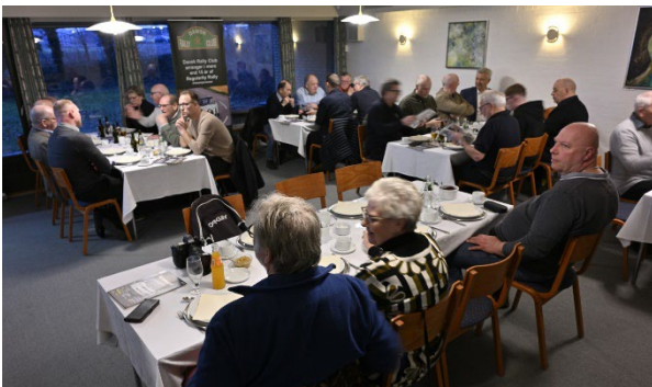
38 fremmødte deltog i DRCs generalforsamling

Onsdag den 11. marts blev DRCs ordinære generalforsamling gennemført i Karleby Forsamlingshus med 38 fremmødte. Iht. traditionen blev der indledt med 2-rettes middag, hvor hovedretten i år var stegt flæsk med persille sovs, hvilket faldt i manges smag, og det blev ønsket som fremtidig fast menu.