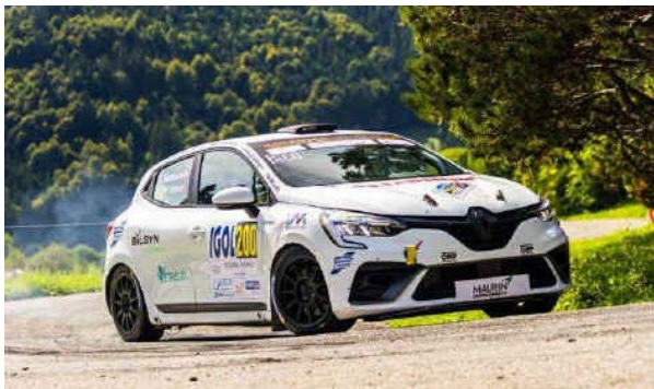
Oliver L. Sørensen / Frederik Glad i Renault Clio Rally5 i 47. ADAC Rallye Kempenich 2026.

Så fra at ligge nr. 20 generelt og nr. 2 i klassen inden WP 7, blev det i stedet til en placering som nr. 27 generelt og nr. 4 i klasse RC5 i tiden 51:55,3.